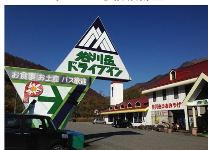
谷川岳ドライブイン