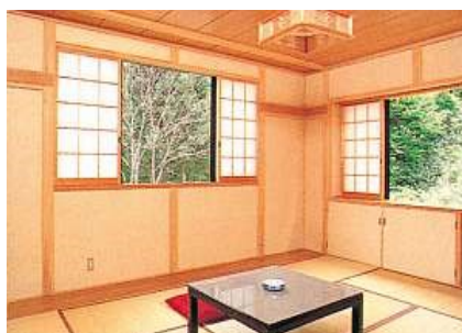
ロッジとんち宿泊部屋