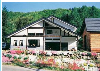
ロッジとんち外観

※作業体験を行いますので、汚れても良い服装や動きやすい服装でご参加ください。 ※当日の状況により内容が変更になる場合もございますので、予めご了承ください。