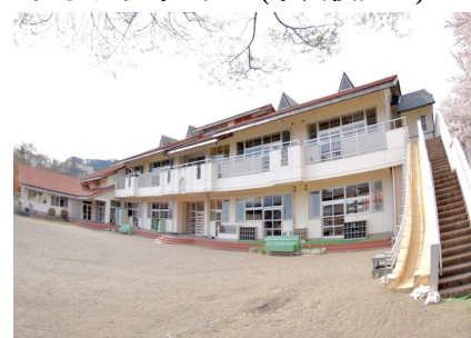
みなかみテレワークセンター

FAX: 027-243-3110 (群馬県地域政策課あて) / E-mail: chiikika@pref.gunma.lg.jp