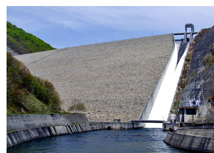
みなかみ町のダム(奈良俣ダム)